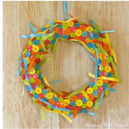
χρωματισμένα ρολά υγείας και κουμπιά...