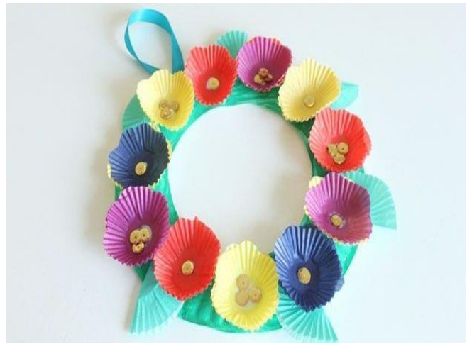
μικρά παλιά μολυβάκια ή χάρτινες θήκες γλυκών...

...καπάκια μπουκαλιών, καλαμάκια, κορδέλες... οι ιδέες είναι ατελείωτες!